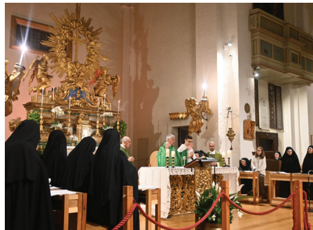
L'arcivescovo Renato Boccardo

Diverse coppie di genitori il pomeriggio di domenica scorsa sono giunte a Montefalco, nel Santuario di Santa Chiara della Croce, riempiendolo nelle tre navate. Alcune con diverse primavere di matrimonio vissute, altre più giovani. Provenivano da varie zone della Diocesi. Tutte erano