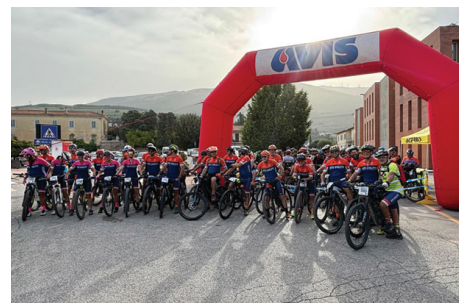
I bikers dell'MTB Spoleto